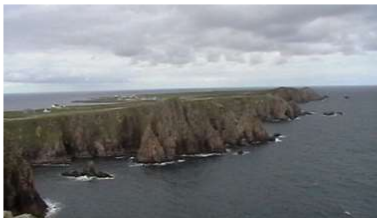
Więcej zdjęcie na www.polskieni.com/galeria.